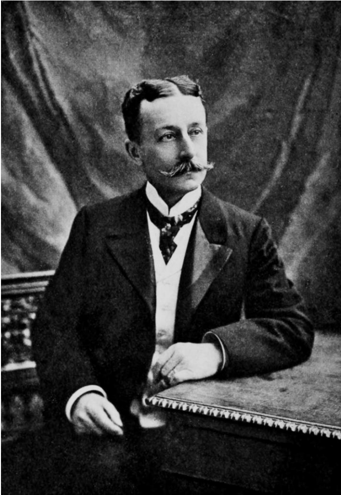
René Bazin (1853-1932)

René Bazin adoptera avec une absolue fidélité les instructions sociales de Léon XIII.